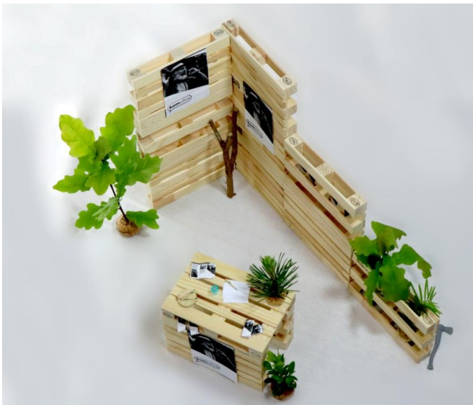
Variante 4 Vogelperspektive

Variante 4: Großer Messestand mit Beratungstresen und Ausstellungsflächen