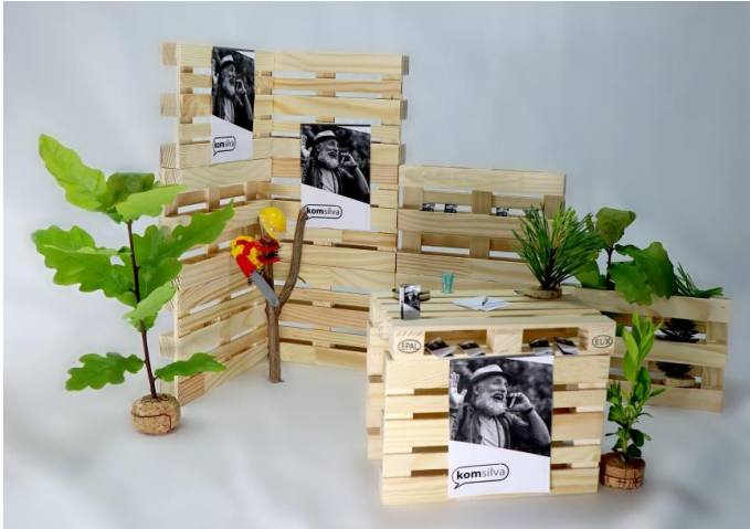
Variante 4 Frontansicht