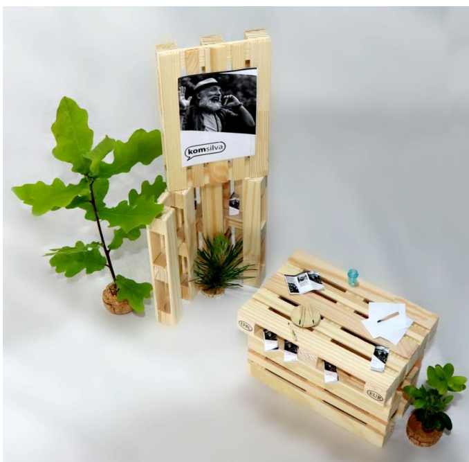
Variante 1 Vogelperspektive

Variante 1: Kombination aus Ausstellungswand und Beratungstresen