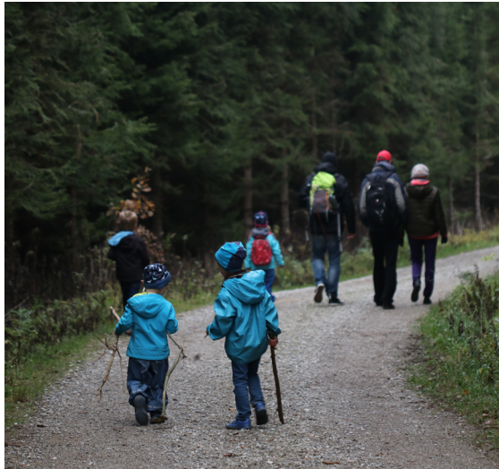
Gemeinsam den Wald besuchen