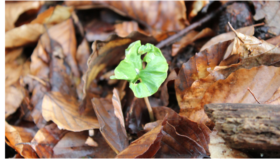
Vorsorge als Fürsorge für kommende Generationen