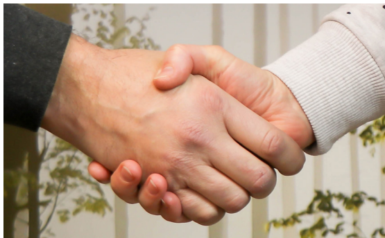
Beratung durch starke Partner