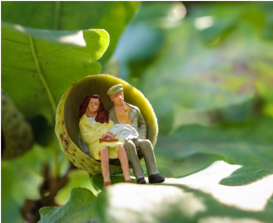
Mit Wald entspannt in die Zukunft

Hobby Erbe Brennholz Natur TRADITION Freude Zubrot Holz Vorsorge Familie werk Gemeinschaft Ausgleich