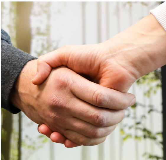
Ansprechpartner für Waldbesitzer*innen